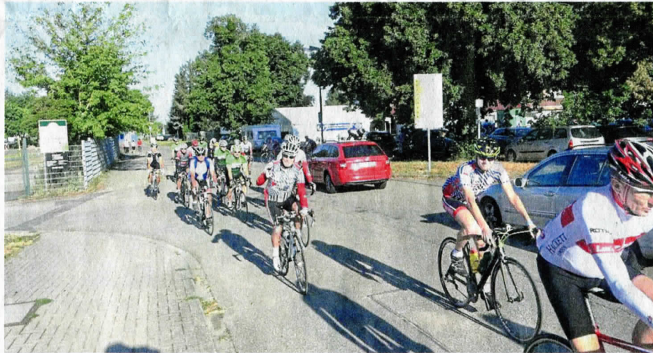
Sportlich: Teilnehmer der Badischen Eröffnungsfahrt mit Start in Forchheim. Die Veranstaltung bildet traditionell den Auftakt der Saison des RSV.

Teilnehmen kann jeder, der ein Fahrrad hat, die Strecke eignet sich nach Angaben des Vereins sowohl für Rennräder und Tourenräder als auch für Mountainbikes und E-Bikes. Für letztere gebe es auf dem Rundkurs allerdings keine Lademöglichkeiten. Start ist zwischen 9 und 11 Uhr beim Vereinsheim des RSV Concordia in Forchheim. Wie der Verein mitteilte, gibt es zwei Touren, eine kürzere und eine längere: Die kürzere ist 54 Kilometer lang und